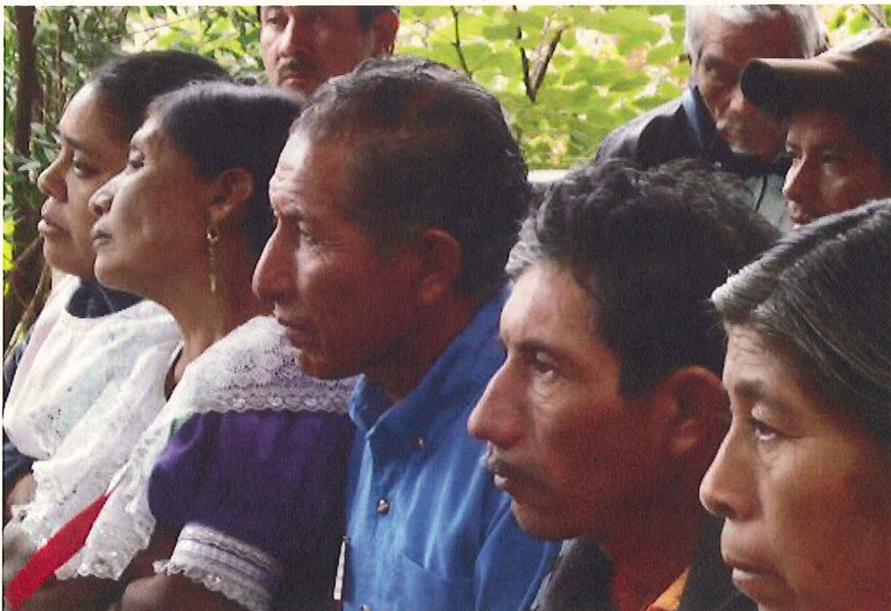
Session de sensibilisation et de formation sur la prévention de la tuberculose organisée par Médecins du Monde-Suisse pour les communautés indigènes du Chiapas au Mexique.

Sur une base de dialogue et d'échanges, nous proposons aux communes d'élaborer ensemble un partenariat sur mesure. Ce partenariat sera adapté en fonction de leurs ressources (financières et humaines), de leurs priorités d'action (géographiques ou thématiques) et de leurs collaborations actuelles (avec des acteurs menant des actions dans le domaine de la coopération internationale).