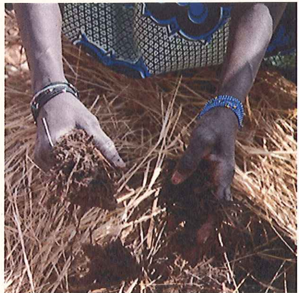
Au Burkina Faso, le CEAS met en oeuvre des projets d'agréoecologie pour les paysans locaux.

assure le contrôle du suivi et de la bonne conduite des projets. La Commission de suivi financier contrôle les rapports et décomptes financiers. Les contrats de contributions signés avec les associations membres de Latitude 21 prévoient le remboursement du montant de la contribution en cas de problème majeur au sein du projet. De plus, la fédération offre des formations et un suivi continu aux associations qui mènent des projets de développement afin d'en améliorer la qualité.