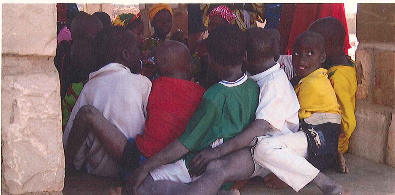
Groupe d'enfants dans une école soutenue par l'Association Mail-Mali.

A travers la collaboration avec Latitude 21 , chaque contribution de collectivité publique neuchâteloise peut avoir un effet de levier important. En effet, la Confédération dispose d'un mécanisme de financement permettant de compléter les montants mis à disposition par les collectivités publiques cantonales. Ce mécanisme fonctionne déjà dans d'autres cantons et Latitude 21 souhaite solliciter son application dans le Canton de Neuchâtel pour les années à venir. Une contribution, même modeste, permet ainsi un soutien concret à une initiative locale.