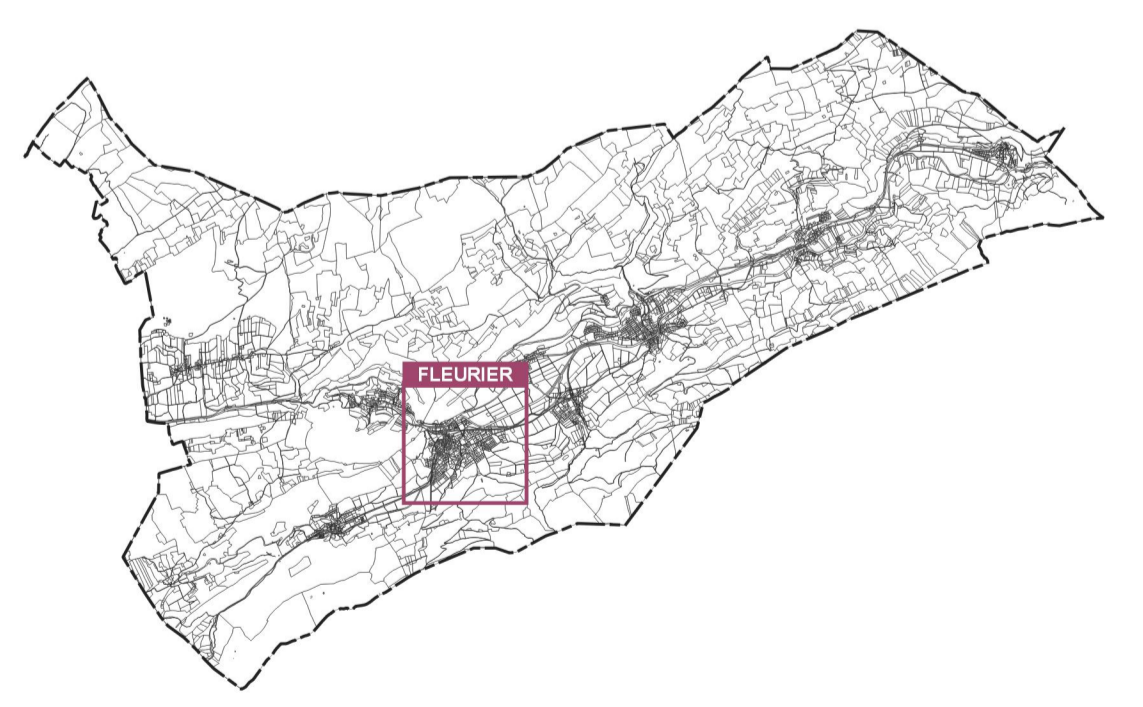
Plan de situation : Val-de-Travers 1:150 000